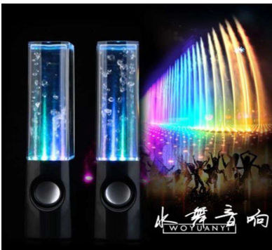
Haut parleur lumineux jet d'eau

Forme : ..... (Description : À quoi ça ressemble ?)