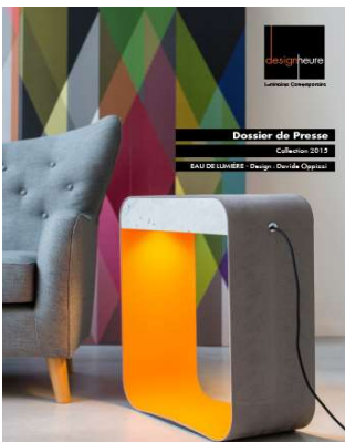
Design heure Dossier de presse

Forme : ..... (Description : À quoi ça ressemble ?)