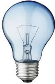
Ampoule à filament

Forme : ..... (Description : À quoi ça ressemble ?)