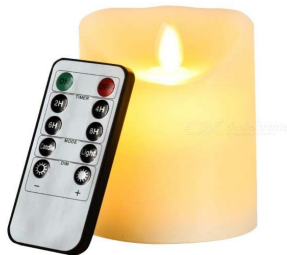
Bougie à LED

Forme : ..... (Description : À quoi ça ressemble ?)