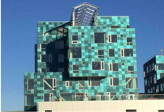
École internationale de Copenhague Façade en panneaux photovoltaïques

Forme : ..... (Description : À quoi ça ressemble ?)