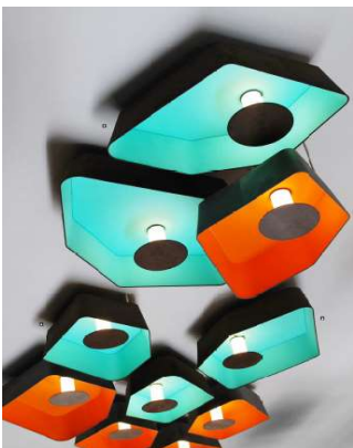
Collection Nénuphar par Kristian Cavaille

Forme : ..... (Description : À quoi ça ressemble ?)