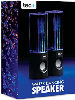
Haut parleur lumineux jet d'eau

Forme : ..... (Description : À quoi ça ressemble ?)