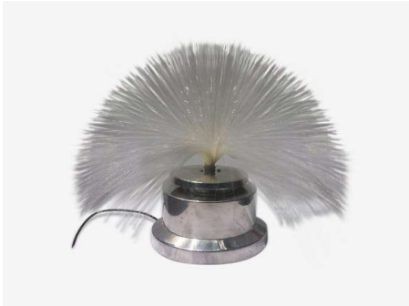
Lampe à fibres optiques

Forme : ..... (Description : À quoi ça ressemble ?)