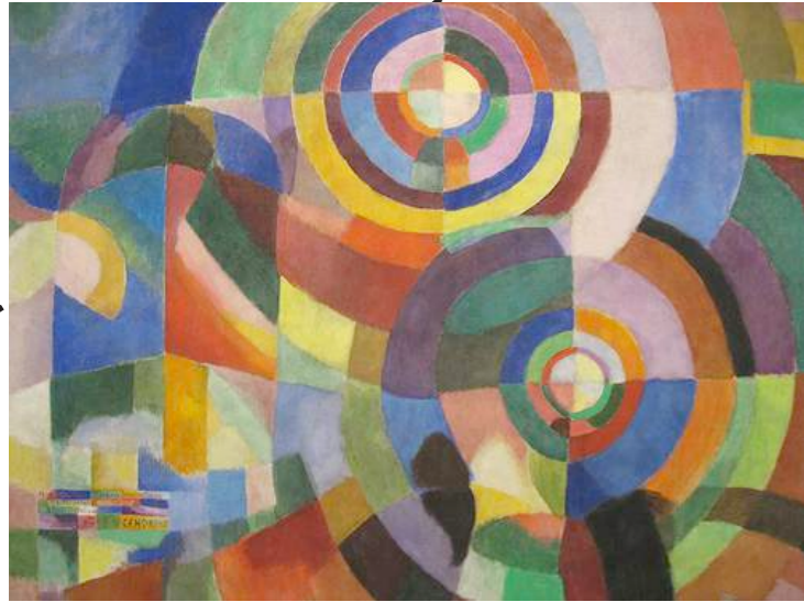
Sonia Delaunay, Prismes électriques, 1913-1914

Costume de «Cléopâtre» par Sonia Delaunay, 1917.