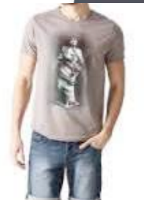
Un motif placé