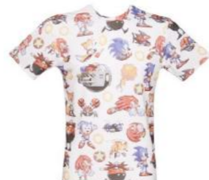
Un motif All-over : textile dont le ou les motifs se répètent de façon continue et régulière sur toute la surface.